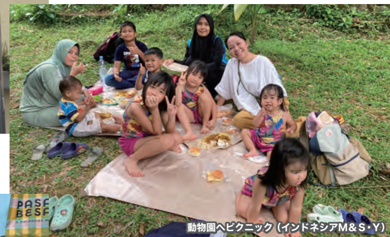
動物園へピクニック (インドネシアM&S・Y)