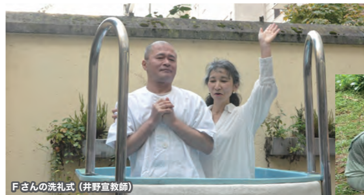
Fさんの洗礼式 (井野宣教師)

近年アジアで宣教のムーブメントが起きています。アライズ・アジア運動は、「福音の届いていない地に出て行こう！」というビジョンを掲げて、フィリピン、ネパール、スリランカ、香港、モンゴルなどにムーブメントとして飛び火し続けています。また、9 月には韓国でローザヌムの 50 周年目の国際大会が開かれました。対面とオンラインで参加した約一万人が、聖霊の力の必要性、和解と一致、迫害下の教会、AI 社会の宣教など、今日の課題にどう取り組むかを、再確認しました。今、世界は戦争や内乱、迫害や災害などによって混乱、分断されています。神の愛を受け、福音を託されたクリスチャンこそが、和解と一致、回復の担い手となれるとの励ましを受けました。素晴らしい福音を、日本から世界に届ける貴重な動きに携わるお一人一人が、来るべき年も、神様のお力を受けて前進するようにと、心から祈ります。「天には神に栄光が、地には平和が御心に叶う人々にあるように。」